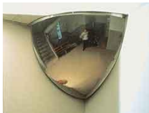
Se fija al ángulo de muro con tacos y tornillos