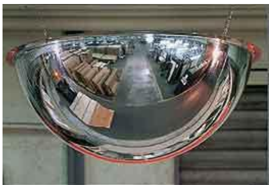
Se fija al techo con cadenas